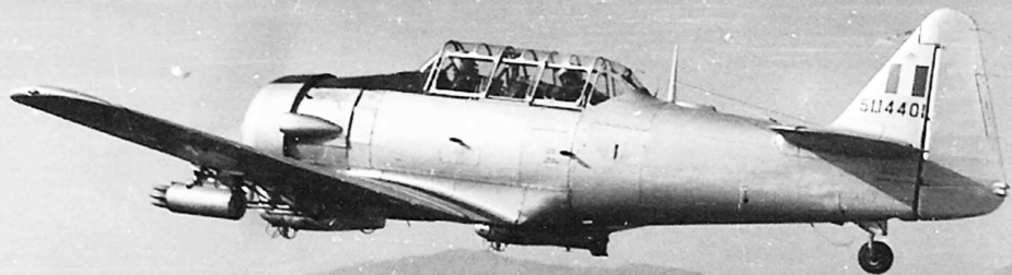
Orléansville, Algérie, 14 juillet 1959

EALA 10/72 – Orléansville, le 14 juillet 1959