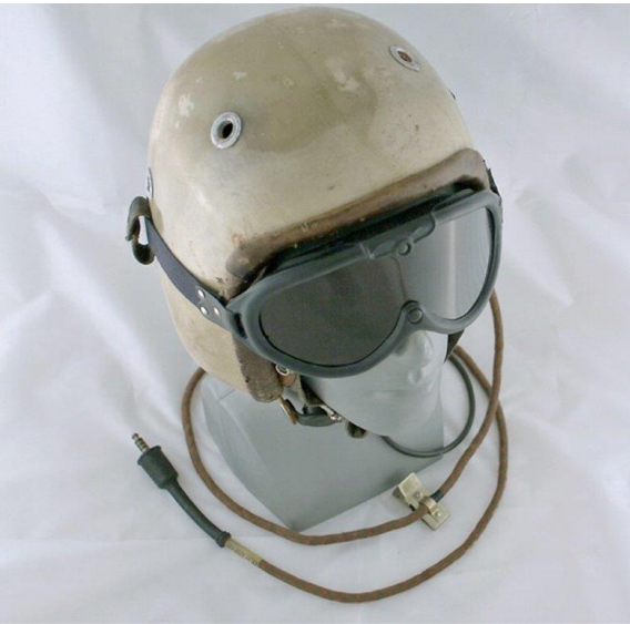
Casque et laryngophone