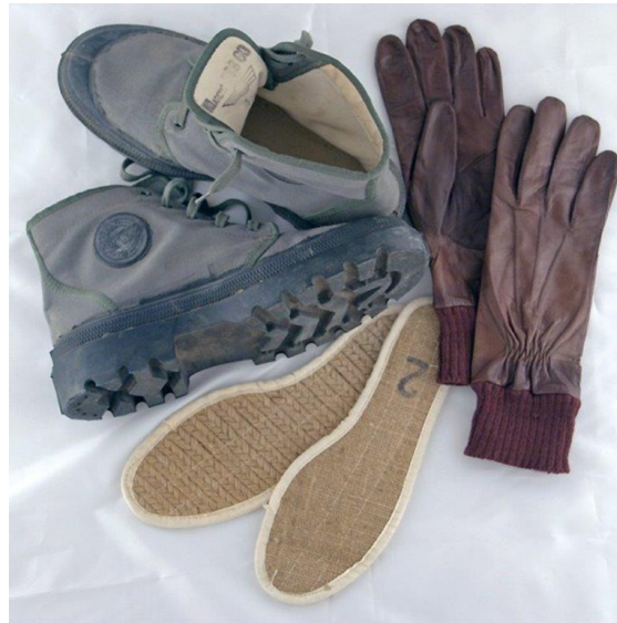
chaussures et gants