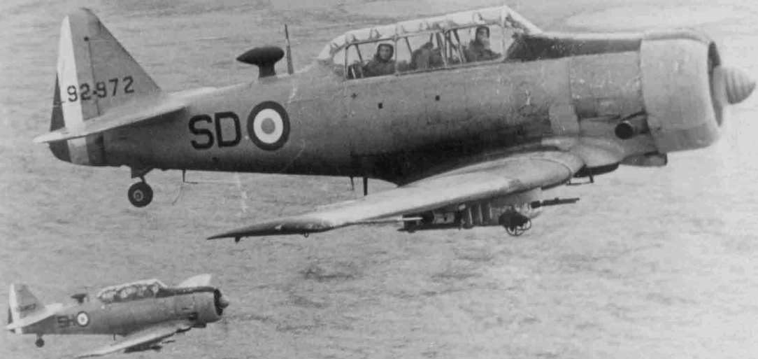
EALA 9/72 – Sud-Oranais, 1958