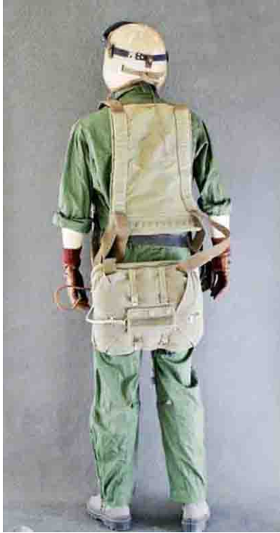
Pilote et observateur de T-6, tenue de vol