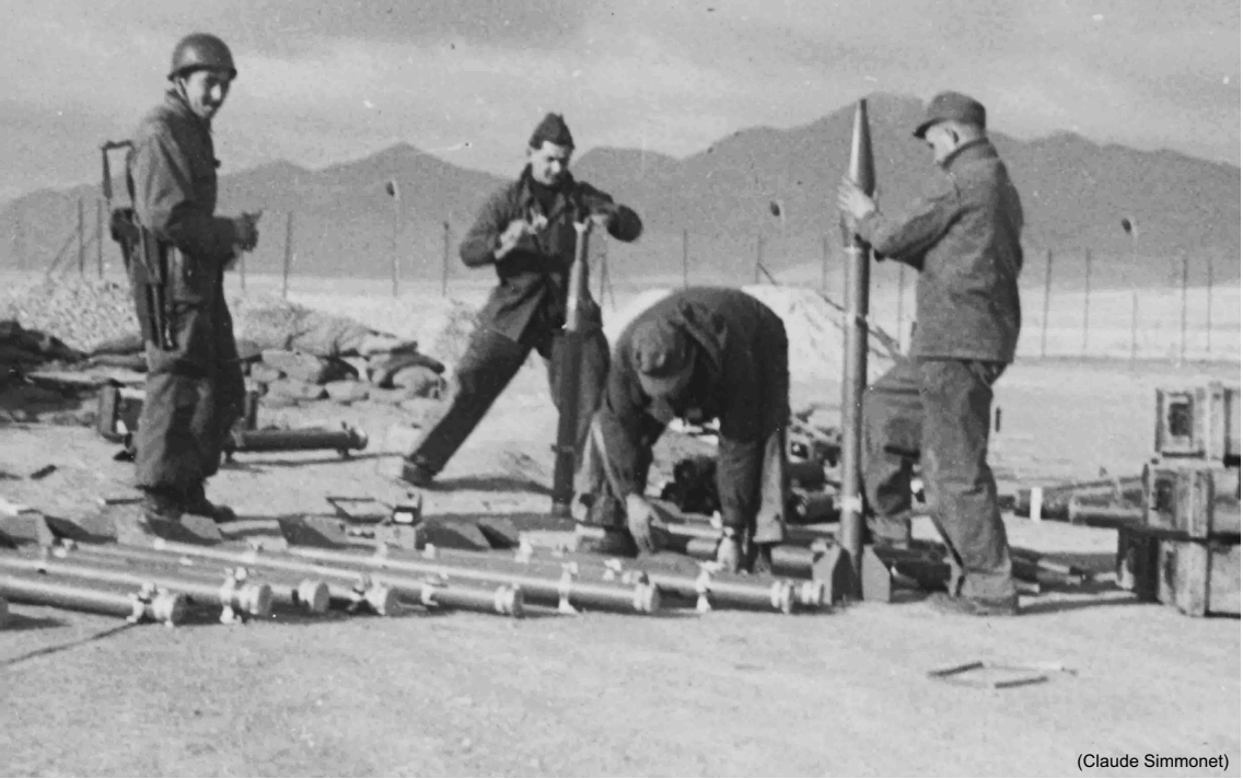
EALA 9/72 – Méchéria 1958, assemblage des roquettes T 10