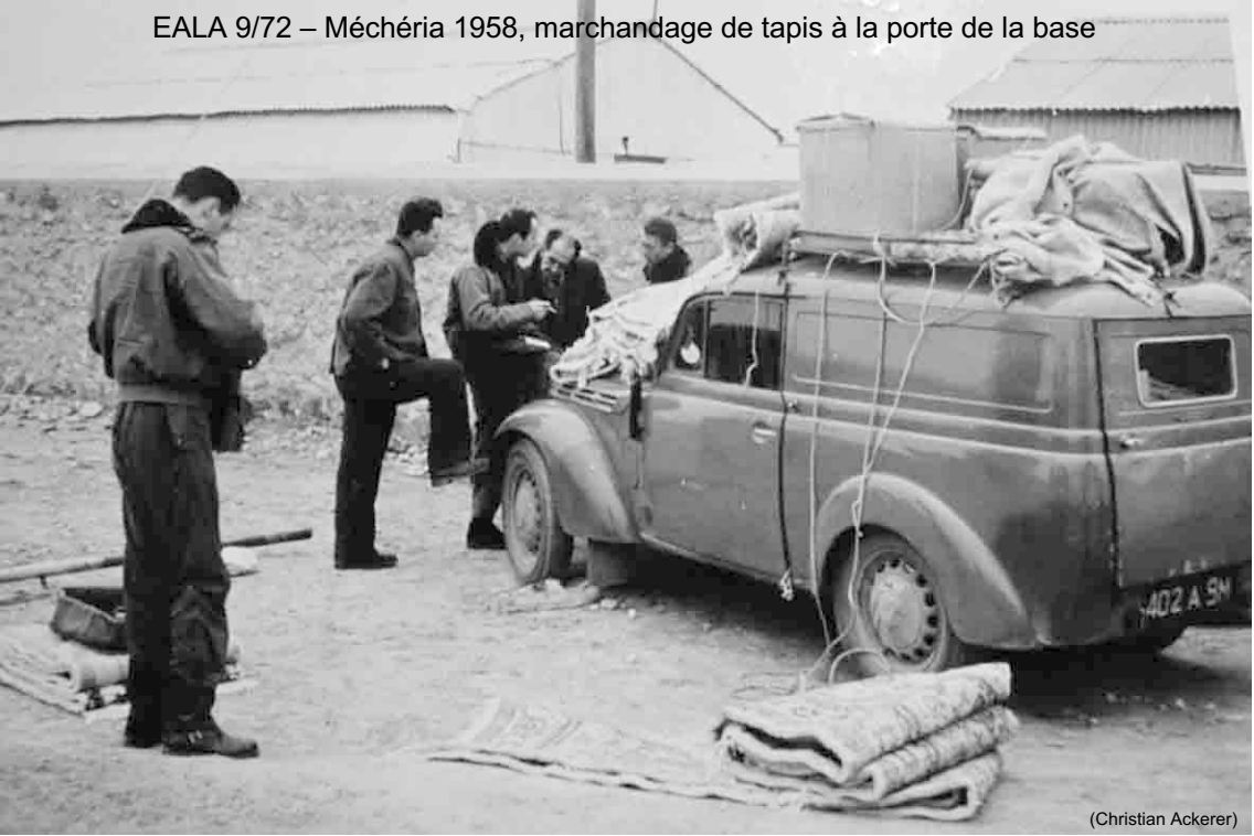
EALA 9/72 – Méchéria 1958, marchandage de tapis à la porte de la base