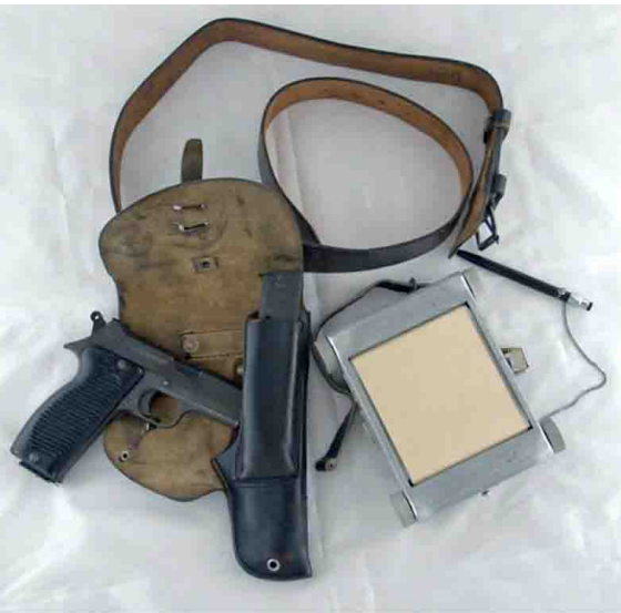
Pistolet MAC 50 et roule-note