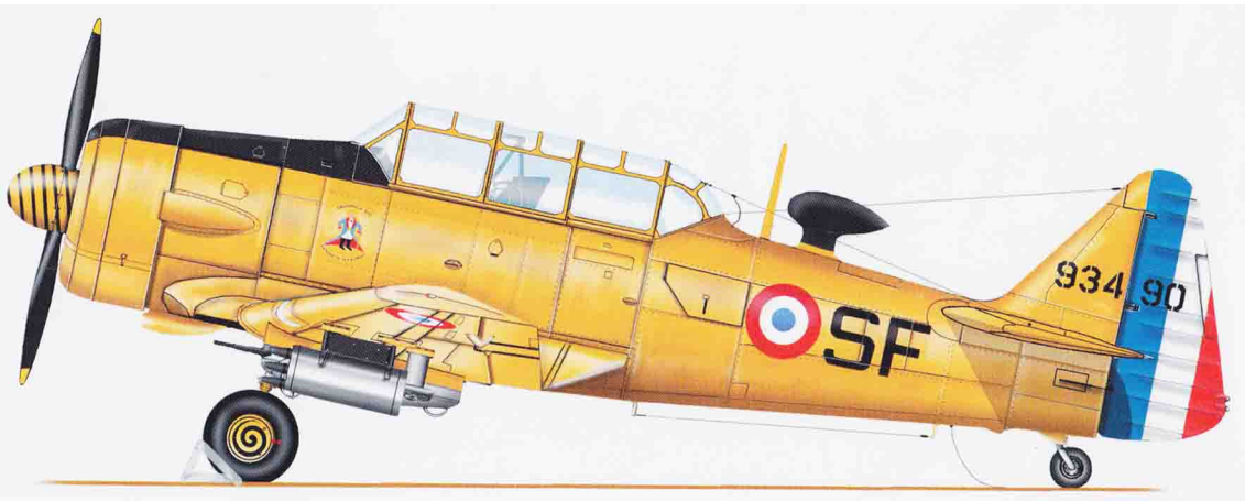
EALA 9/72 – North American T-6G