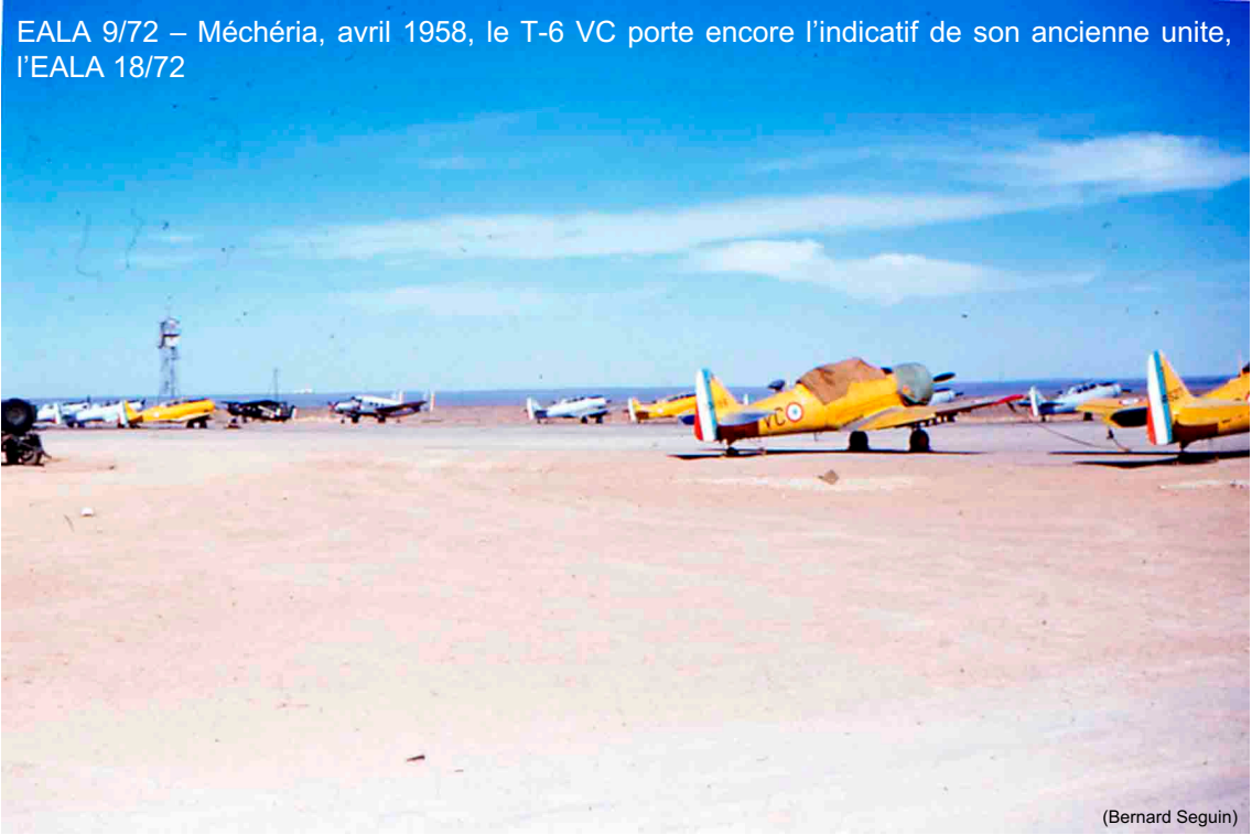
EALA 9/72 – Méchéria, avril 1958, le T-6 VC porte encore l'indicatif de son ancienne unite, l'EALA 18/72