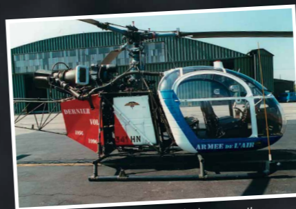
1996 : départ de l'Alouette II

Au coeur de la vie des unités hélicoptères de l'Armée de l'air, le CIEH entretient l'héritage légué par les pionniers des voilures tournantes.