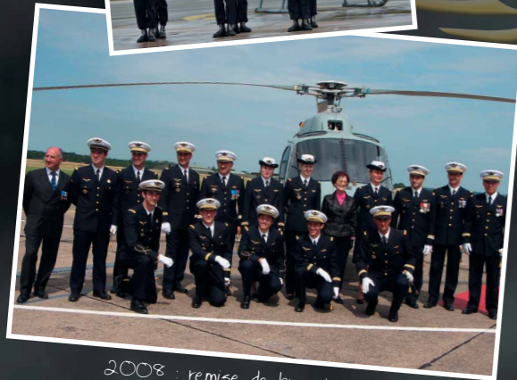
2008 : remise de brevets STO