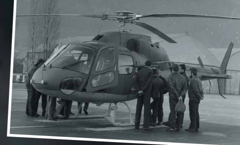
1984 : arrivée du 1 er Ecureuil au CIEH

Il assure le suivi du référentiel documentaire ainsi que la standardisation des procédures afin de promouvoir le niveau d'expertise nécessaire à la parfaite réalisation des missions confiées aux hélicoptères de l'Armée de l'air.