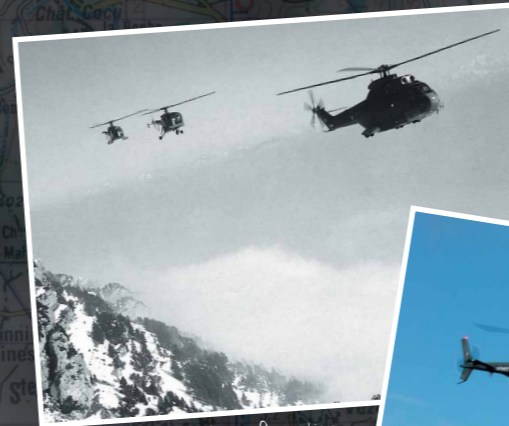
Vol en formation