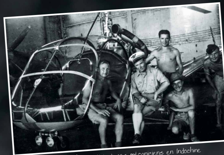
1950 : Lt Santini et ses mécaniciens en Indochine

Le Colonel Alexis Santini a organisé et commandé les Sections Hélicoptères Air d'Indochine, la Division d'Instruction Hélicoptères de la Base Ecole 725 du Bourget-du-Lac (Savoie), la Section Hélicoptères de la 5 e Région aérienne (Alger) et la direction « Hélicoptères et Commandos » du Commandement de l'aviation légère de l'Armée de l'air.