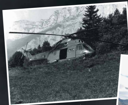
Vol en montagne