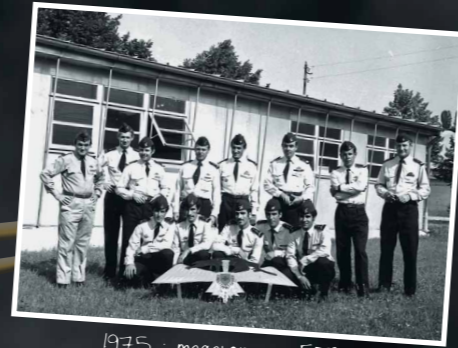
1975 : macaronnage ETG