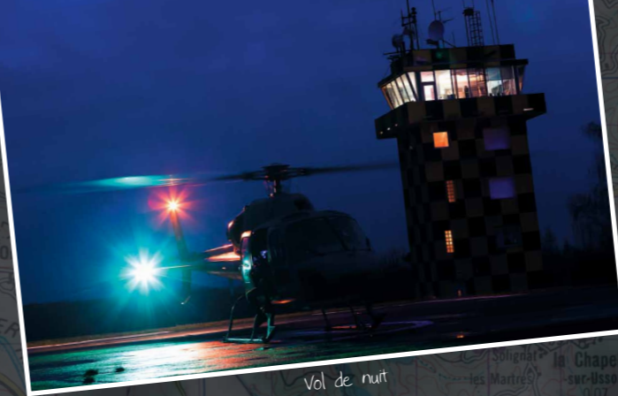
Vol de nuit

Du H34 au Caracal, en passant par l'Alouette II, l'Alouette III, le Puma, l'Écureuil, le Fennec et le Super Puma, le CIEH a su rassembler en son sein toutes les compétences afin de faire face aux évolutions de l'Armée de l'air.